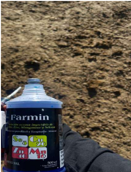
Figura 3. utilización del vitamínico