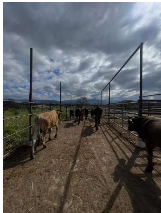
Figura 4. Desplazamiento de los bovinos