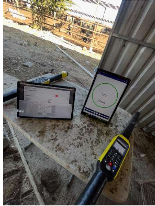
Figura 2. utilización del software