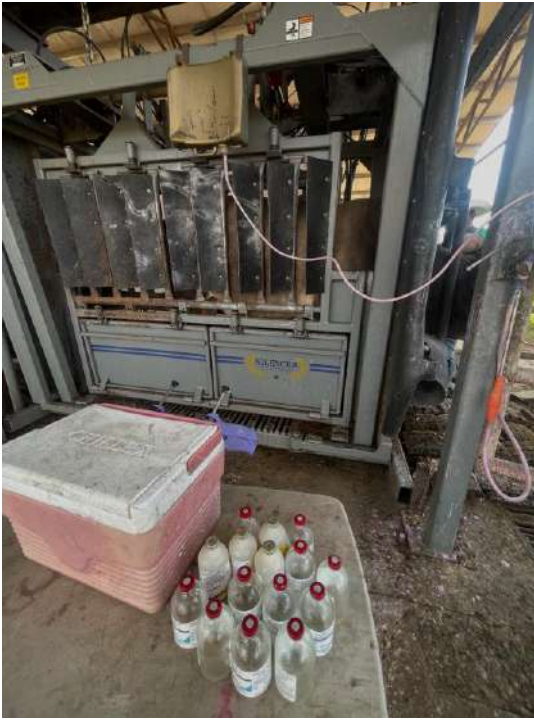
Figura 1. Aplicación de vacunas al momento de recepción