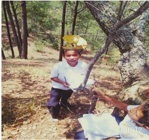
Anexo 20. Listado de participantes socialización de la propuesta técnica.