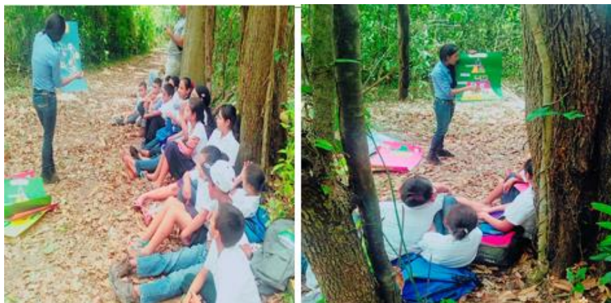
Figura 3. Charla de clasificación de los seres vivos

recorrido por el bosque en el cual se le explicaba a los niños (as) sobre los seres vivos. Luego se efectuó la elección del sitio, al elegir el sitio se realizó la charla haciendo uso de láminas ilustradas con recortes de imágenes de autótrofos y heterótrofos, cadenas alimenticias, niveles tróficos y redes alimenticias (Figura 3).