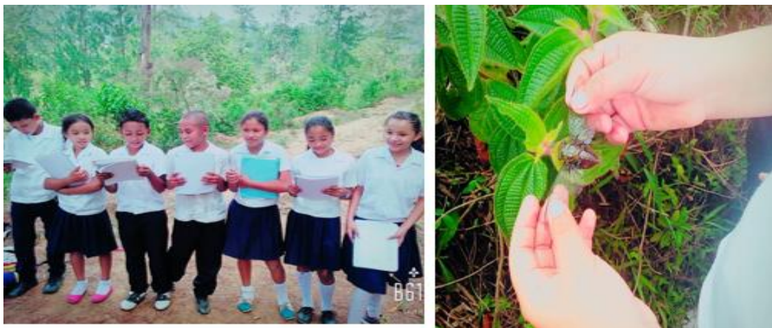
Figura 4. Charla sobre la biodiversidad

Después del recorrido se procedió con la realización de la charla haciendo uso del material didáctico o láminas ilustradas las cuales tenían una serie de imágenes y definiciones sobre la biodiversidad. Seguidamente se efectuó la dinámica de los animales y su hábitat, la cual se desarrolla en una ronda en la que los niños bailan, Mientras bailan el educador elige un niño y le menciona cualquiera de los elementos agua, aire, tierra y mundo. Entonces el niño seleccionado dice el nombre de un animal que vive en cualquier elemento, dirige nueva mete la ronda, si el niño dice mundo todos cambian de posición, al terminar los niños contestaran la guía del niño (Figura 4, Anexo 12).