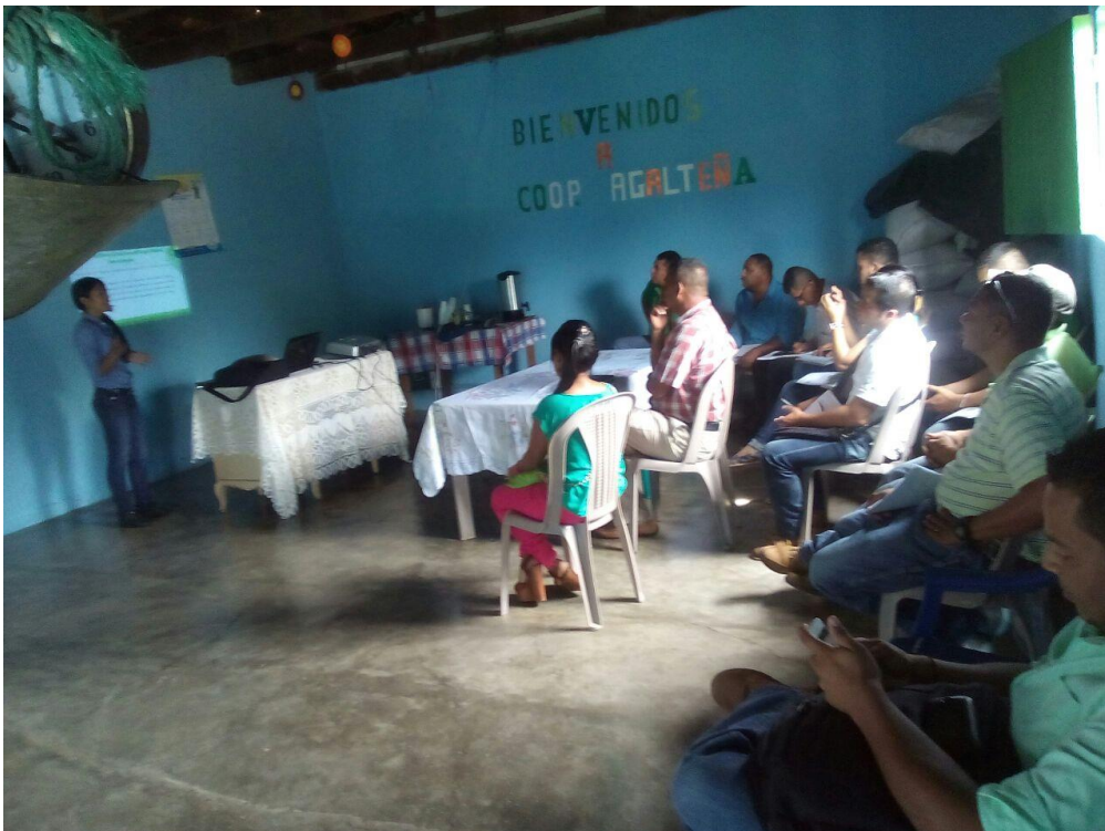
Figura 6. Socialización del PEB con autoridades del municipio de Gualaco

A demás pidieron que el proyecto se realizará en todas las 18 escuelas que se encuentran en la zona de influencia del Parque Nacional Sierra de Agalta (PNSA) y a las aledañas al municipio de San Esteban, para lograr cubrir a todos los niños. Luego solicitaron otra reunión donde se invitara a todas las autoridades del municipio de Gualaco y San Esteban y todas las organizaciones existentes en el municipio para darles a conocer la propuesta del PEB y lograr la integración de todas las autoridades para financiar el proyecto y que siga funcionando en toda el área protegida (Figura 6).