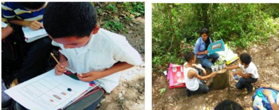
Figura 5. Recolección de semillas

tipos de dispersores bióticos y abióticos que existen. Luego realizaron un recorrido en el cual los niños recolectaron distintos tipos de semillas, las identificaron después describieron el tipo de dispersión y las pegaron en la guía del niño (Figura 5).