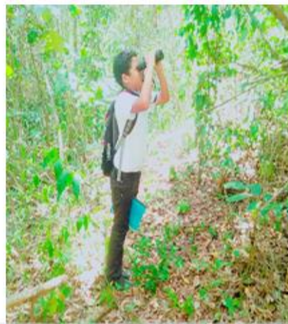
Figura 2. Observación de flora y fauna

Visita 2: En la segunda visita se desarrolló la guía dos con el tema de la clasificación de los seres vivos según su alimentación capacitando a los niños de cuarto, quinto y sexto grado de las escuelas: José Trinidad Cabañas, José Cecilio del Valle, José Santos Guardiola, Rural Mixta 30 de Mayo. Las cuales se desarrollaron por medio de un