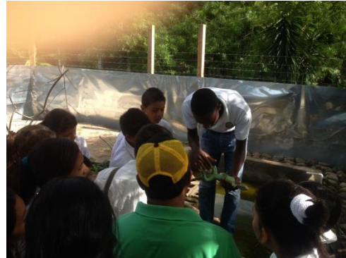
Figura 13 Charlas a estudiantes del centro básico Alvarado Contreras del Barrio el Espino