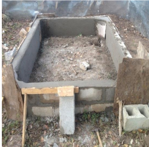
Figura 8 Avance del bebedero