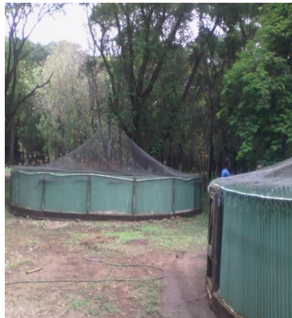
Figura 14 Contacto con otro Zoo criadero Figura 15 Visitando otro zoo criadero