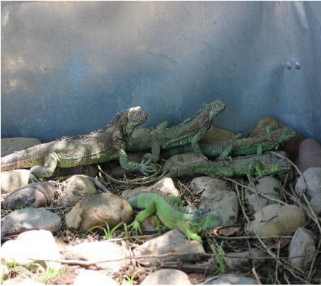
Figura 11 Pie de cría