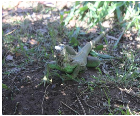
Figura 12 Pies de cría