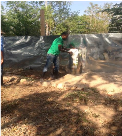
Figura 9 Instalación de arena