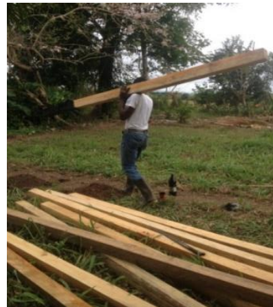
Figura 5 Excavación del equipo