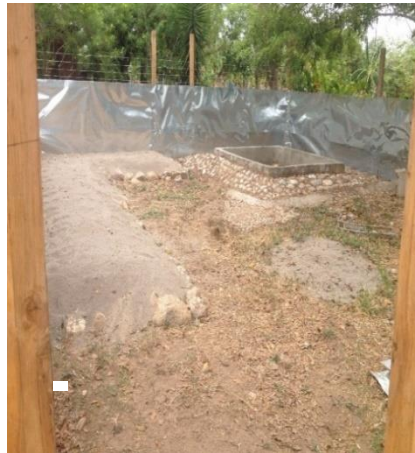
Figura 10 Banco de arena instalado