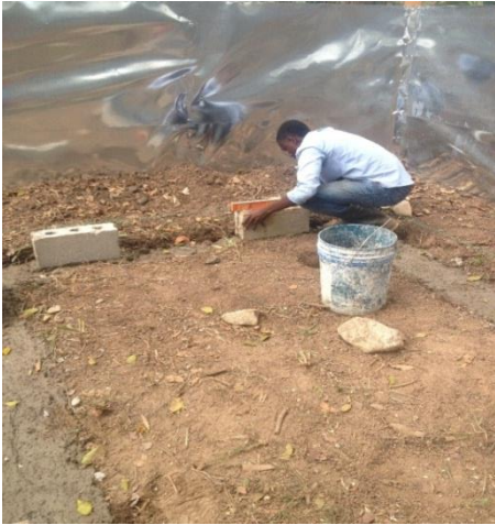
Figura 7 Trabajo en el bebedero