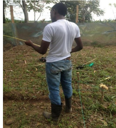
Figura 3 Selección del lugar del zoo criadero Figura 4 Medición del lugar para establecer el zoo criadero